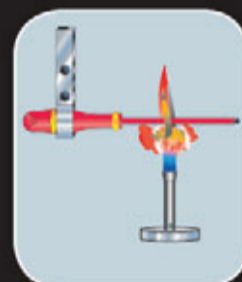
Essai de combustion