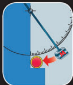
Résistance aux chocs