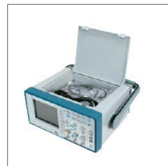
Un compartiment accessoires intégré dans le boîtier