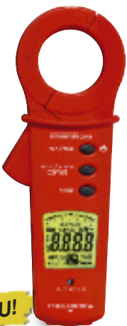
CM 9 (verfügbar ab 07/2008)

*Alle Preise verstehen sich als empfohlene Verkaufspreise zuzüglich MwSt.