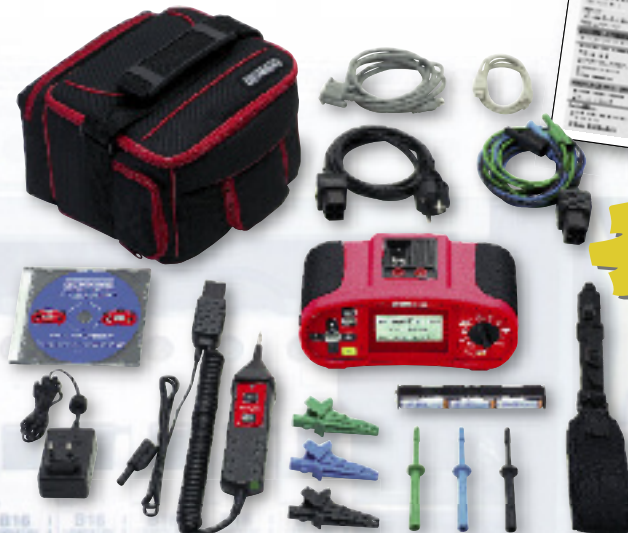
Lieferumfang BENNING IT 120