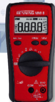
CAT IV 600 V