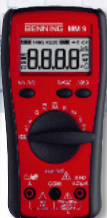
CAT IV 600 V