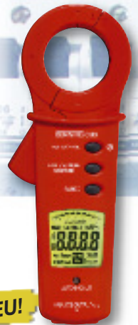
CM 9 (verfügbar ab 07/2008)