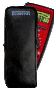
Alle Digital-Multimeter inkl. Schutztasche, Sicherheitsmessleitungen und Batteriesatz