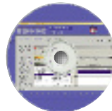
Kostenlose BENNING 700 Info-CD auf Anfrage