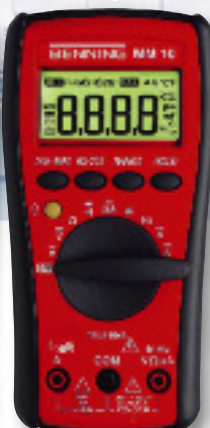
CAT IV 600 V