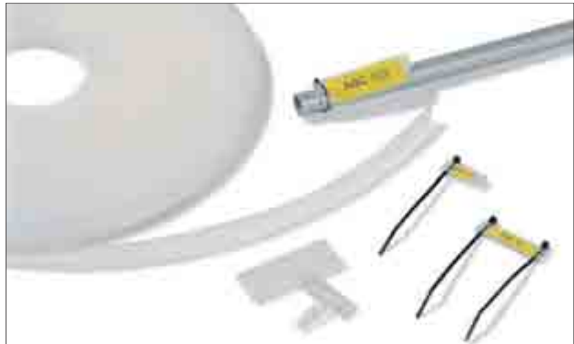
Vielseitig einsetzbar zur Kennzeichnung: Helafix HC und HCR.

Kennzeichnung von Kabelbäumen, Kabeln, Röhren, Transportsystemen, Ventilen, Sensoren, zur Inventarkennzeichnung auf Maschinen oder sonstigen Teilen.