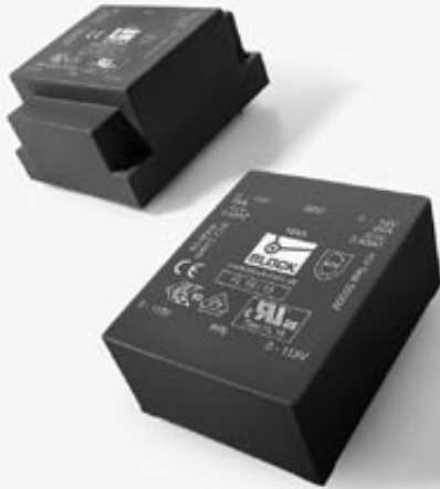
FL 42/12, FL 18/15