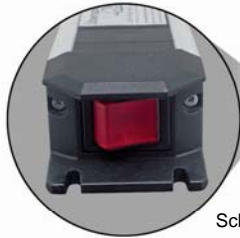
Schalter stirnseitig (3S) am Kopfende