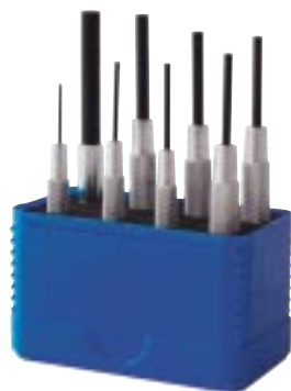
Art. No. 457 102 5 Halterung holder